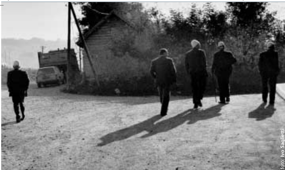
Gruppo di anziani kosovari, con il tradizionale copricapo nella periferia della capitale