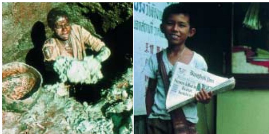
Estrazione dell'argilla in Rwanda

hanno redatto un documento comune "Un mondo a nostra Misura", presentato all'Assemblea Generale delle Nazioni Unite.