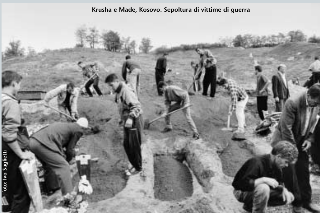
Krusha e Made, Kosovo. Sepoltura di vittime di guerra

Dal gennaio 2000 è stata formata una Joint Structure of Interim Administration [Struttura Comune di Amministrazione ad interim], composta da 20 dipartimenti guidati simultaneamente