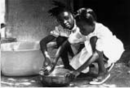
"I bambini nel terzo mondo, se lavorano muoiono di fatica, se non lavorano muoiono di fame". Boutros Gali, ex segretario dell'ONU

vendono i loro corpi per le strade d'Italia sono, secondo le stime del Dipartimento pari opportunità, tra le 15 e 18 mila. Fra loro, le vittime del trafficking sarebbero il 10 per cento, vale a dire tra le 1.500 e 1.800. Ma secondo altre stime le donne vittime di una vera e propria tratta di esseri umani, sarebbero dalle 3 alle 5 mila.