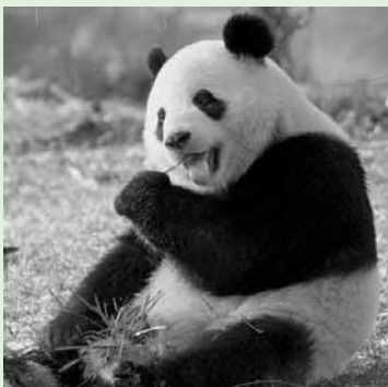
foto in alto: Il Dodo ( Raphus cucullatus ) scomparso prima del 1681 da sinistra a destra: Il Panda cinese ( Ailuropoda melanoleuca ); l' Alca impennis , ultimo pinguino artico, scomparso nel giugno del 1844; la Tigre siberiana ( Panthera tigris altaica )

Ridurre la perdita di biodiversità del nostro Pianeta entro il 2010: è questo l'obiettivo fissato dall'ONU che tutti i Paesi del mondo hanno sottoscritto in occasione della Conferenza delle Parti della Convenzione sulla Diversità Biologica e del Summit Mondiale sullo Sviluppo Sostenibile - Countdown 2010. Un'iniziativa globale ambientale volta al coinvolgimento delle imprese del settore privato, oltre che delle Istituzioni e dei Governi, per la riduzione significativa della perdita di biodiversità a livello globale entro il 2010, dichiarato dalle Nazioni Unite come anno mondiale della Biodiversità.