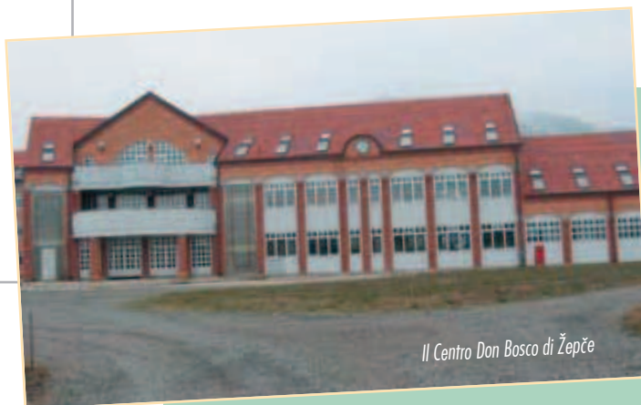
Il Centro Don Bosco di Žepče

la frequenta di avere nuovi orizzonti sulla convivenza e sull'integrazione culturale. Con tutta la modestia possibile, vorremmo che la nostra scuola diventi per i giovani di Žepče e dintorni la scuola, la casa, il cortile e la chiesa. Proprio come sognava Don Bosco per i suoi giovani. ■