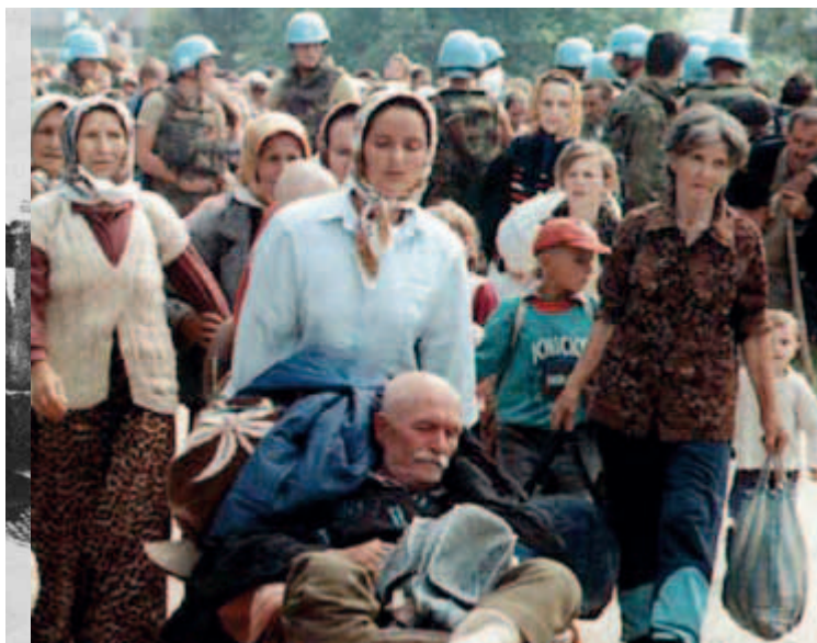
Profughi bosniaci in fuga da Srebrenica. In seguito all'occupazione serba di Srebrenica del luglio 1995, i bosniaci musulmani furono costretti ad abbandonare la città, che le Nazioni Unite avevano loro riservato dichiarandola area protetta

Credo che tale speranza sia il frutto non solo di un percorso interno ma anche del sostegno proveniente da molti popoli europei e non solo. Abbiamo accettato tante mani tese pronte ad aiutarci: Stati, organizzazioni e singole persone →