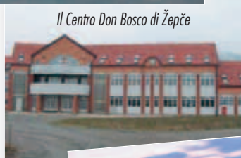
Il Centro Don Bosco di Žepče