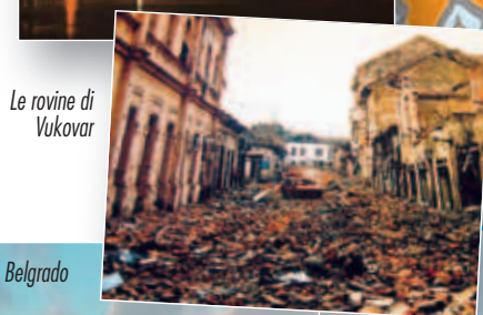
Le rovine di Vukovar