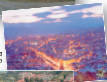
Panorama di Sarajevo