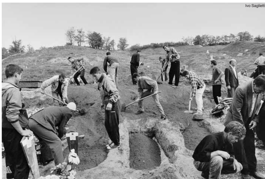
Il tragico rituale della sepoltura delle vittime della guerra fratricida in Jugoslavia

Lascieremo Žepče a malincuore e, proseguendo lungo l'unica strada che porta a Sud, dopo poche ore avvisteremo i minareti di Sarajevo. Semplicemente arrivando al nostro hotel ci renderemo conto dei tre grandi avvicendamenti storici che ha subito Sarajevo: superando il quartiere moderno, in pieno stile ➔