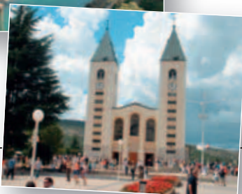
La Chiesa di San Giacomo a Medjugorje

sovietico, entreremo nel quartiere auto-ungarico, e per concludere ci troveremo tra le vie strette del quartiere turco. Qui ci immergeremo in un altro tempo, cultura, religione: visiteremo la Baščaršija, il centro storico turco e austro-ungarico, il triste mercato della strage e ci chiederemo ancora una volta: perché?