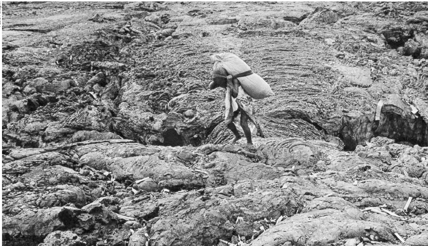
Ragazzi trasportano sacchi di carbone nella città ricoperta dalla lava dopo l'eruzione del vulcano Niyaragongo, Goma, Repubblica Democratica del Congo